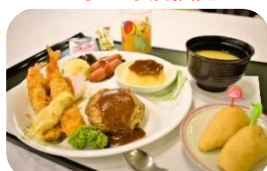
お子さまランチ 800円 (税込880円)