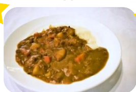
カレーライス 600円 (税込660円)