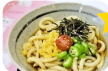
うどん 400円 (税込440円)