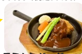
デミハンバーグ ごはん・みそ汁付き 700円 (税込770円)