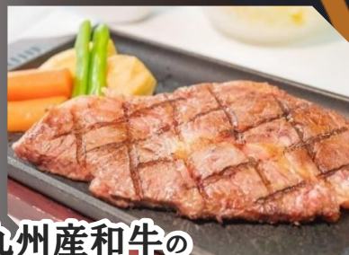
九州産和牛のサーロインステーキセット 税込 3,630円