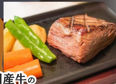
国産牛の特上フィレステーキセット 税込 3,960円